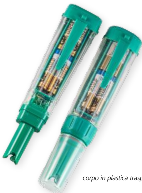
corpo in plastica trasparente