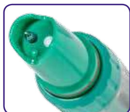
ORP 51 elettrodo di ricambio per ORP 5