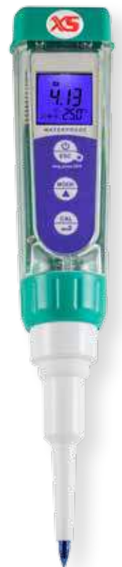
pH 5 FOOD