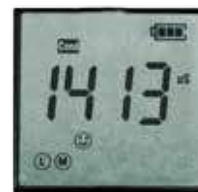
Display COND 1