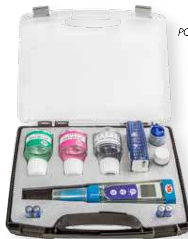
PC 5 kit