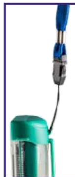
Cordino da collo