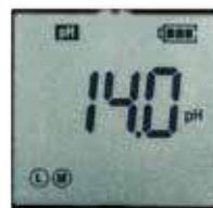
Display pH 1