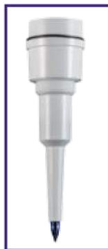
SPH 51 elettrodo FOOD di ricambio per pH 5 FOOD