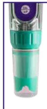
Cappuccio di protezione utilizzabile come becker di calibrazione